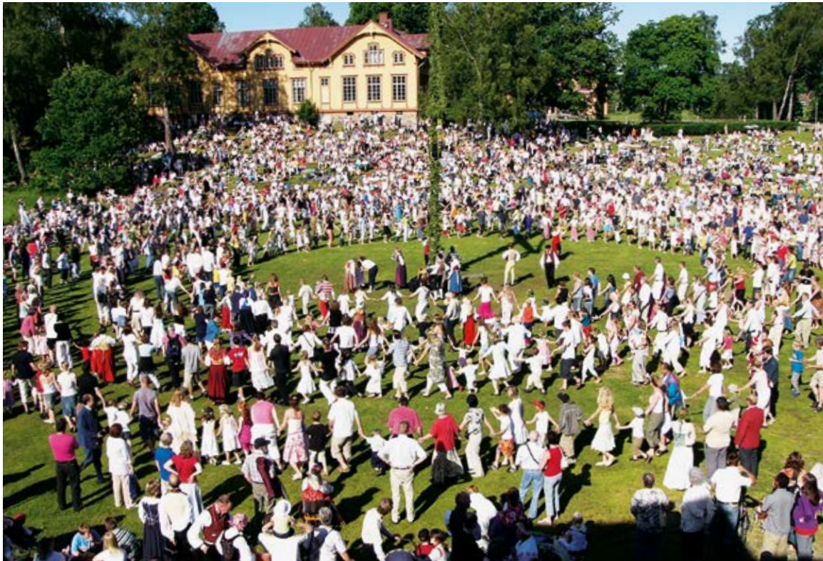
جشن نیمه تابستان در نس (Nääs).