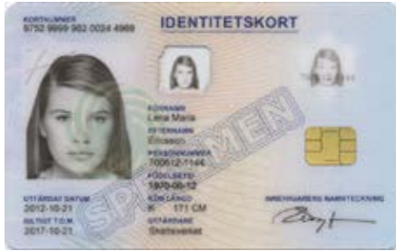
کارت هویت