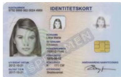
کارت شناسایی عکس: اداره مالیات

برای اطلاع بیشتر در مورد فردی که هویت شما را می‌شناسد به پایگاه اداره مالیات مراجعه شود www.skatteverket.se