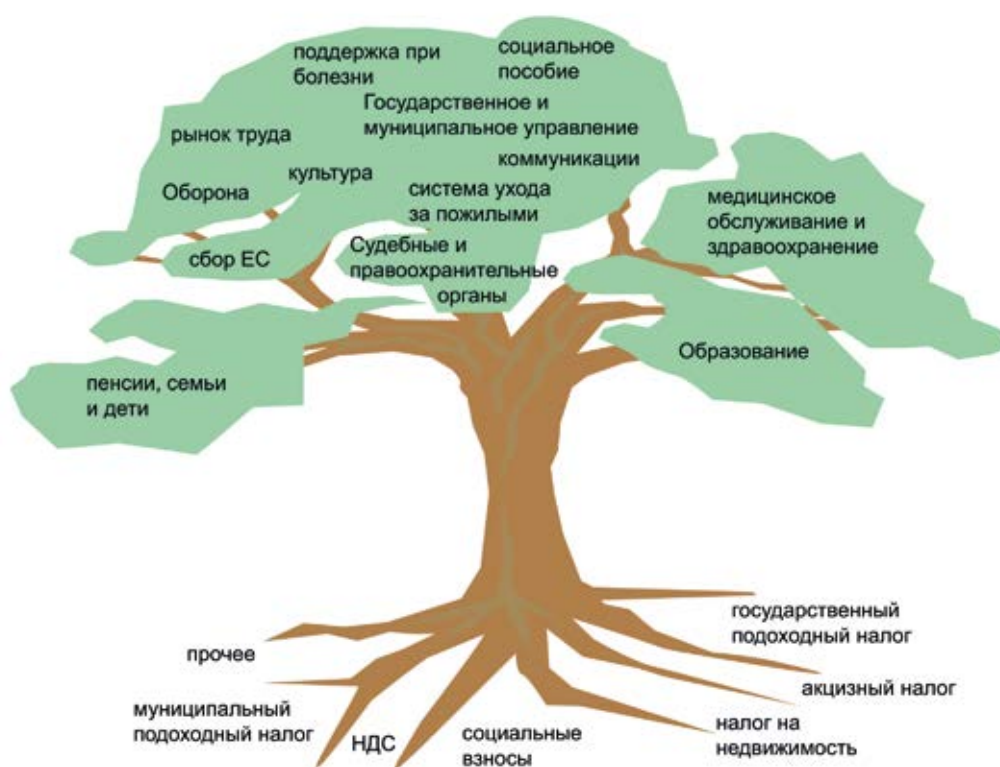
Иллюстрация: Налоговая служба

Работая по найму, вы платите налог со своей заработной платы. Такой налог называется подоходным налогом. Заработная плата до вычета подоходного налога называется брутто-зарплатой. Заработная плата после оплаты налога называется нетто-зарплатой, или чистой зарплатой. Нетто-зарплата – это те деньги, которые остаются вам на жизнь. Шведская налоговая система построена таким образом, что те, кто зарабатывают