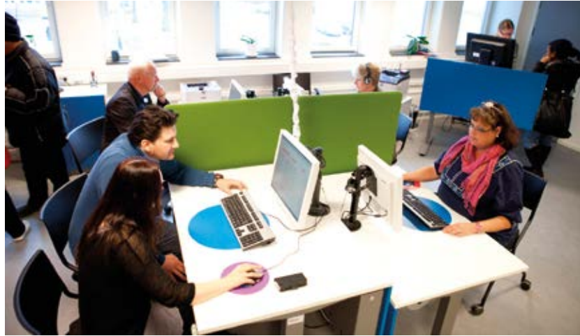
Masawirqaade: Xafiiska shaqada

ku jiri kartaa mid ka mid ah qasnadooyinka ceeymisyada, a-kassa, oo ah urur dhaqaale oo lacag siiyo xubnaha ka tirsan oo shaqo la'anta ku dhacday. Haddii aad dooneysid in aad ku jirto a-kassa waa in aad bil kasto dhiibtaa kharash.