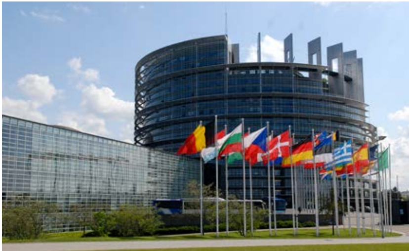
Europaparlamentet i Bryssel.

lokaltrafik och regionplanering. Det finns idag 20 landsting och regioner i Sverige. Regionerna och landstingen leds av en folkvald församling, regionfullmäktige respektive landstingsfullmäktige. Man kan till exempel säga att Västra Götalandsregionen formellt är Västra Götalands läns landsting.