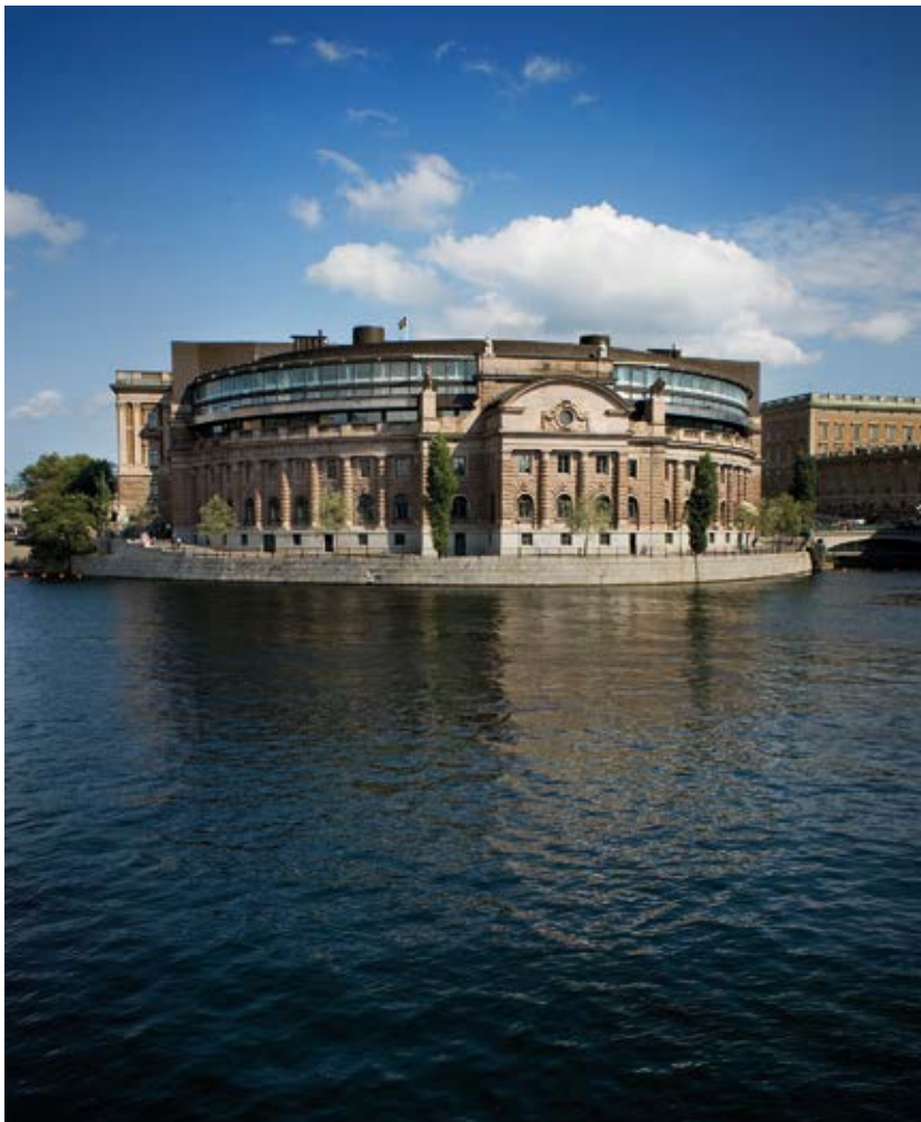
Västra riksdagshuset speglas i Strömmen med vy från väster.

I Sverige fattas beslut på tre olika politiska nivåer. De nivåer som finns är kommunerna, landstingen/regionerna