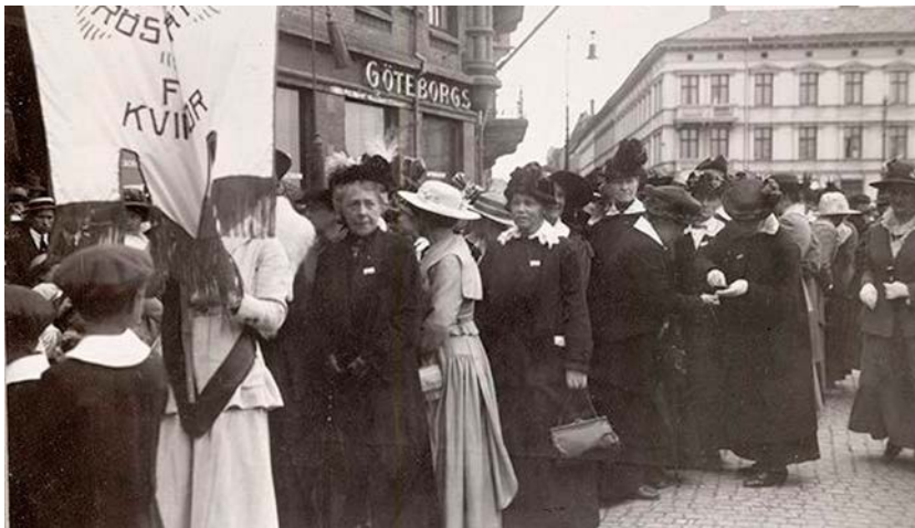
Demonstrationståg för kvinnors rösträtt 1918 i Göteborg.

På 1800-talet utvecklades socialismen, och den mest betydelsefulla personen inom den läran var Karl Marx. Enligt socialismen skulle jämlikhet och rättvisa råda mellan alla människor. Tankarna fick stor spridning, och både fackliga organisationer och föreningar och socialistiska partier startades runt om i Europa. I slutet av 1800-talet höjdes röster för att jämlikhet och rättvisa även skulle omfatta kvinnor.