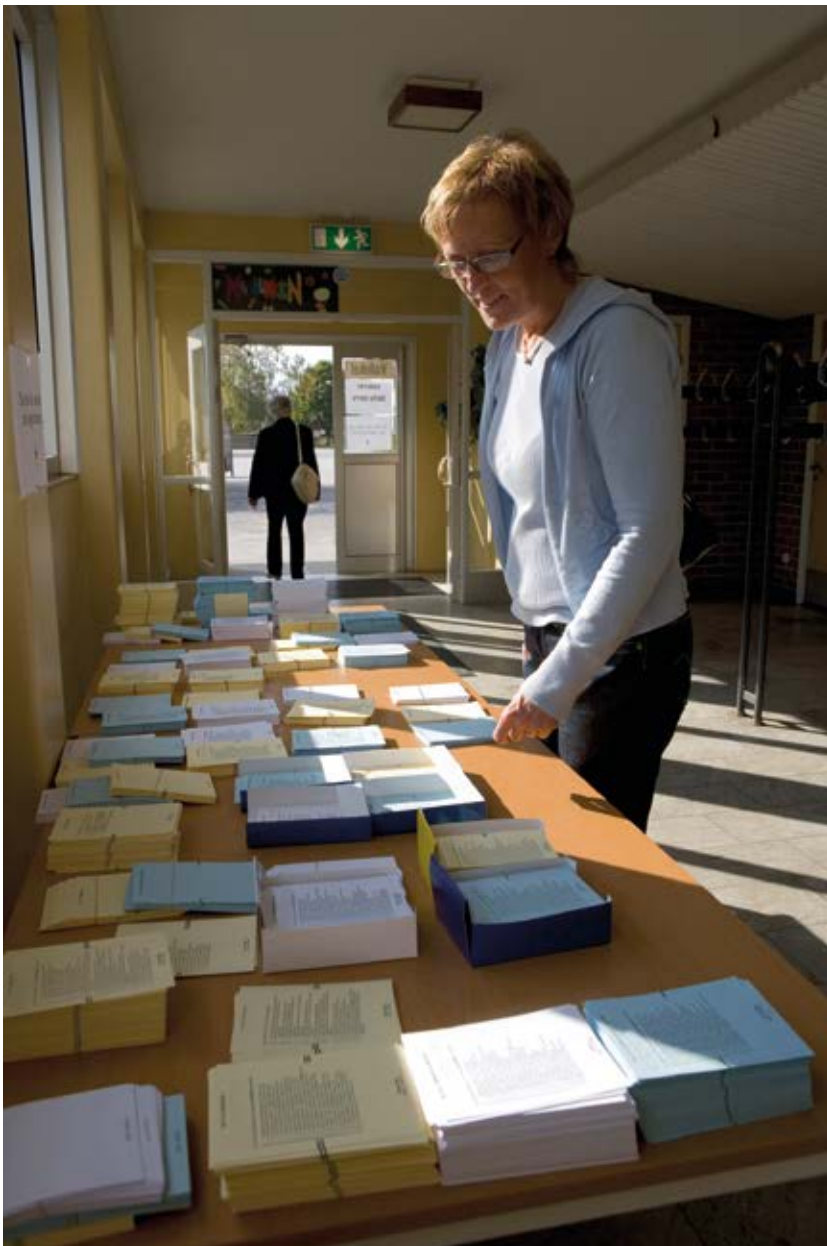
Bild från vallokal där människor röstar.

Att många röstar i valen tyder på att många människor litar på politikerna och det demokratiska systemet. Om riksdag, region/landsting- och kommunfullmäktige ska anses representera folket i sin helhet måste tillräckligt många av de som har rätt att rösta delta i de allmänna valen. I Sverige röstade nästan 86 procent av befolkningen i valet till riksdagen 2014. I valen till landsting/regioner och kommun var det något lägre valdeltagande. När du röstar ökar chansen att någon som tycker som du är med och bestämmer i samhället.