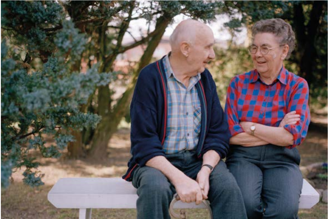
ስክሌ: ኮንዶ ፍሪድ: ዩቲር