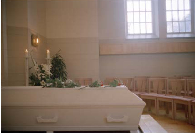
ስክለ፡ ጃገይ ገግውሊትሱ፡ ዮኅና