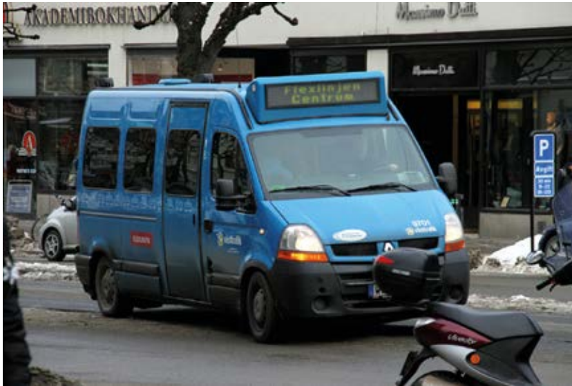
ስእሪ፡ ማቲልዳ ካርልሶን፣ ከተማ የተባረደ